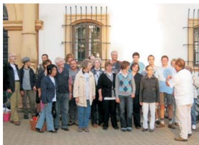
Einweisung um 7 Uhr morgens

fern, die nicht nur während der Veranstaltung, sondern auch im Vorfeld außergewöhnlichen Einsatz geleistet haben, den Förderern und natürlich auch den vielen Besuchern und Käufern, die zum Erfolg des Basars beigetragen haben.