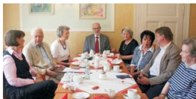
Nachbesprechung von Zeitzeugen

So unterschiedlich die etwa 15 Zeitzeugen waren, so vielfältig war auch die Umsetzung in den Schulen. Inhalte waren die Wohnverhältnisse, das Mit-